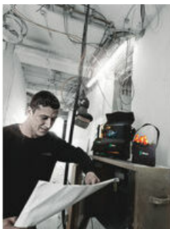
Wera 2go gereedschapsdraagtas