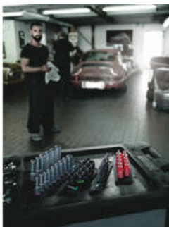
De Wera belts