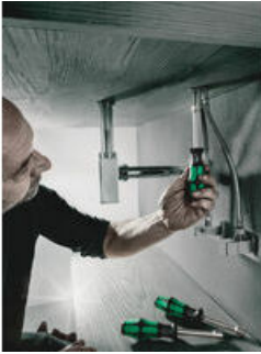
Holle Schacht voor lange draadeinde