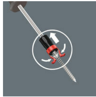
En zo werkt de schroefhouder

Schroefhouder verder in de richting van de greep trekken tot beide armen van de schroefhouder aan de kop van de schroef vast zitten en deze licht zijn gespreid. De Wera-schroefhouder laat de schroef na het schroeven automatisch los!