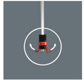
En zo werkt de schroefhouder

De twee grijparmen spreiden zich verder open als ze tegen een oppervlakte worden gedrukt en sluiten zich weer vanzelf als de kop van de schroef is verzonken.