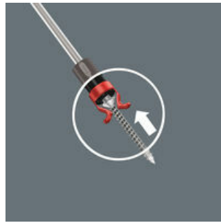
En zo werkt de schroefhouder

Schroef op de punt van de kling in de houder zetten.