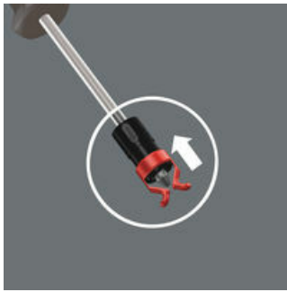
En zo werkt de schroefhouder

De schroefhouder van de punt van de kling van de schroevendraaier schuiven totdat de punt van de kling uit het rubber komt.