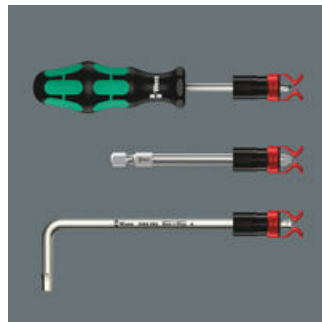
En zo werkt de schroefhouder

De schroefhouder kan ook met inbusleutels en lange bits worden gebruikt!