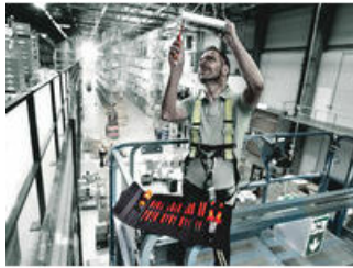
Greep-/wisselklingensysteem Kraftform Kompakt VDE