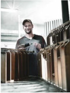
Bits met gereduceerde schachtdiameter