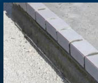
plaatsen kimblokken (richtlijnen kalkzandsteen)