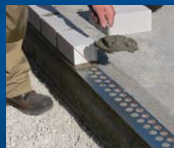
eventueel fixeren - min. 2 nagels per lengte