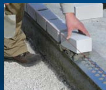
aanbrengen mortel - goed verdelen