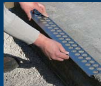
ondergrond stofvrij maken - aanbrengen Kimverbreder